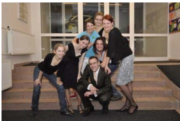
Bývalý koordinátor signály.cz se současným týmem na plese signály.cz