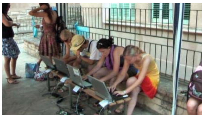
Venkovní internetová kavárna na pře programu SDM v Tarragoně