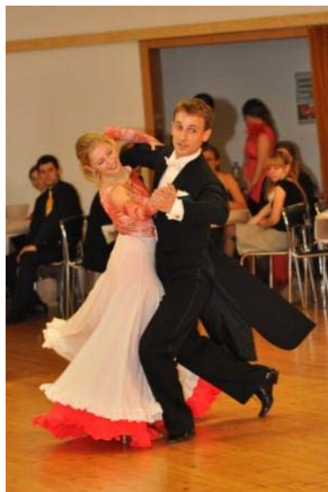
Předtančení na plese signály.cz