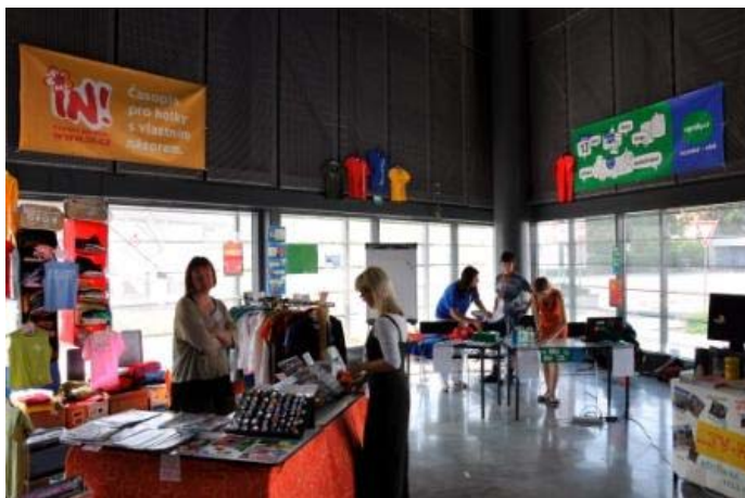
signály.cz na Katolické charismatické konferenci 2011