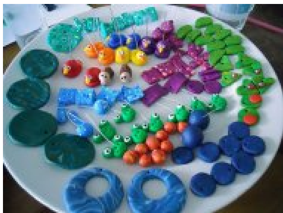
Tvořivý víkend se signály.cz