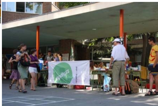
signály.cz na SDM v Madridu