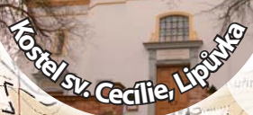
Kostel sv. Cecílie, Lipavka