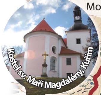
Kostel sv. Maří Magdalény, Kuřim

Děkanství: Modřice, Slavkov 8:45 Znojmo, Vranov n. Dyjí 9:00