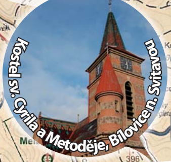
Kostel sv. Cyrila Metoděje, Bilovce n. Svitavou