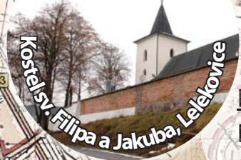
Kostel sv. Filipa a Jakuba, Lelekovice

Děkanství: Hustopeče, Jihlava 8:45 Mor. Budějovice, Telč 9:00