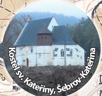
Kostel sv. Kateřiny, Šebrov-Kateřina

Děkanství: Modřice, Slavkov 8:45 Znojmo, Vranov n. Dyjí 9:00