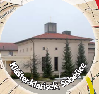
Mništer klarisek, Soběšice

Děkanství: Hustopeče, Jihlava 8:45 Mor. Budějovice, Telč 9:00