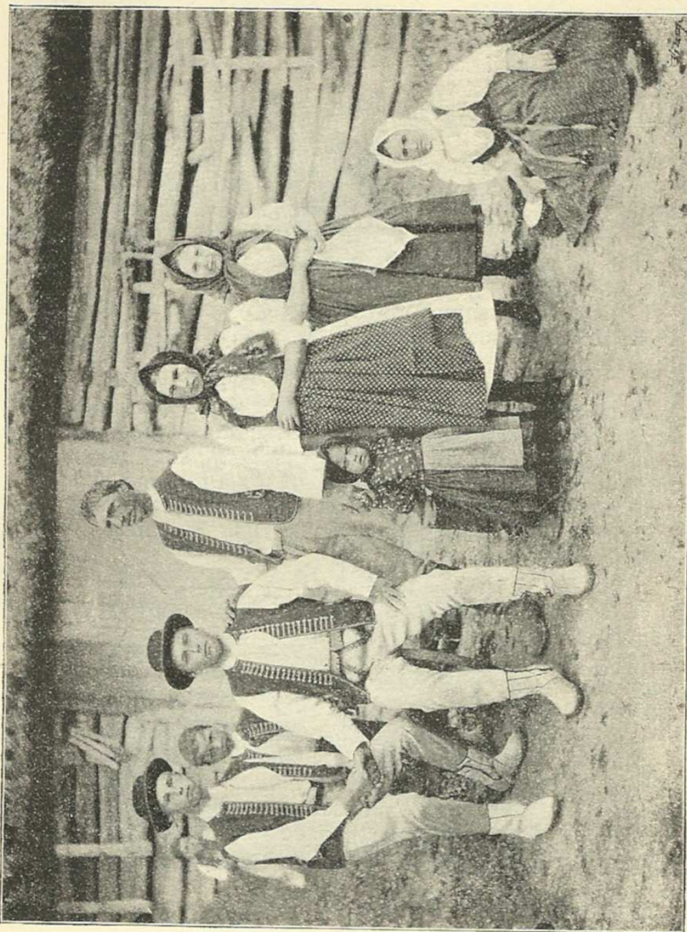
Valaši z Popova u Val. Klobouk.

úplně jenom v zákoutí karlovickém, vyzovském (kolem Polánky) a val.-klobouckém kolem Bilnice. Rožnovský, velmi pěkný druh kroje valašského, úplně vymizel.