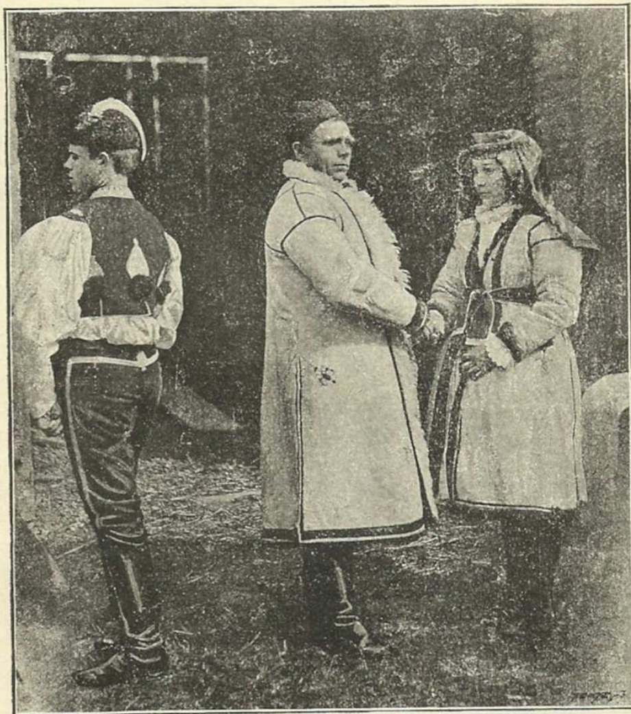
Slováci z Derfle u Uherského Hradiště.

Ke svatebnímu úboru přísluší, alespoň na severním slovácku, plachetka nevěstinská, uprostřed pěkně vyšitá. Tu nosí ženy i ke křtu a na úvod a proto říká se jí místy i „úvodnice“.