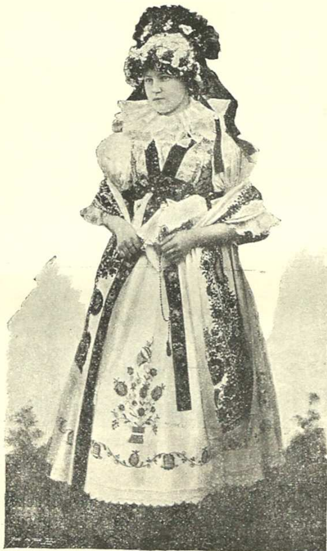
Hanácká nevěsta z Tovačova.