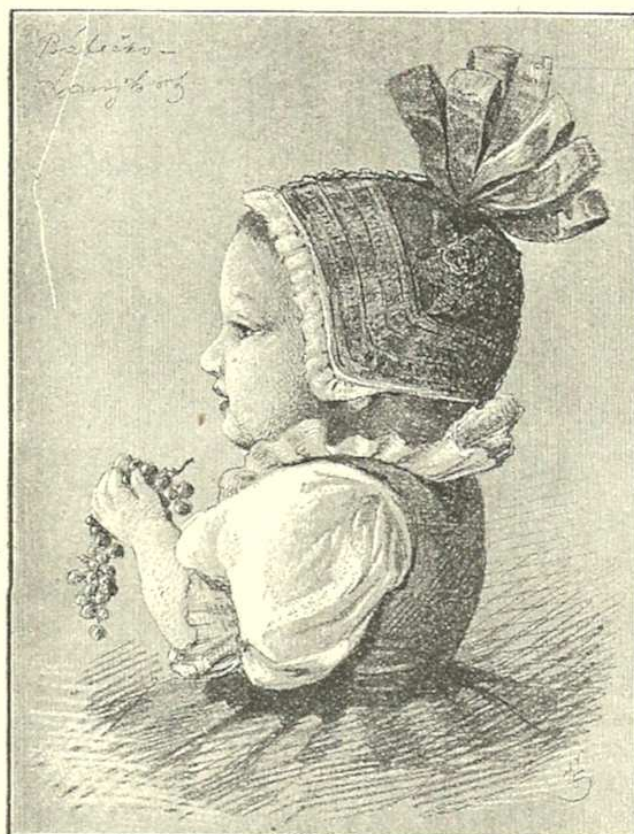
Slovácké děvčátko z Lanžhota.

těné gafky přes boty a děvčátko nemá pořádných botů. Nohavice dostávají chlapci po desátém, někde až po čtrnáctém roce. Do té doby chodí vždy v plátěných širokých gatích, na Kyjovsku v poloměstském tmavém šatu. Také na Břeclavsku nosí do tohoto věku obyčejně různé cajkové šaty.