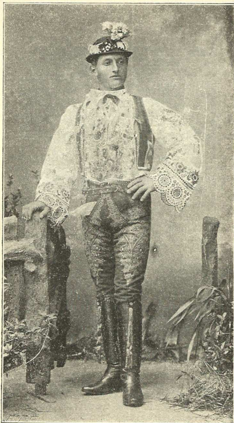
Chorvatský šohaj z Gutfjeldu u Mikulova.