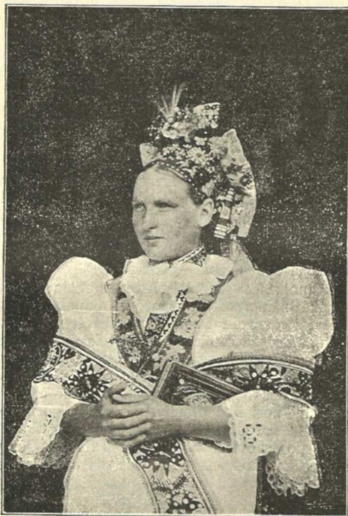
Nevěsta slovácká z Hroznové Lhoty u Strážnice.

Mužští na Brněnsku nosívali žluté nebo černé koženky, často červené, někdy modré kordulky a sice dosti dlouhé, skorem jak nosily se ve století osmnáctém, a kabátce temně modré s velkými mosaznými knoflíky. Klobouky byly tu nad-