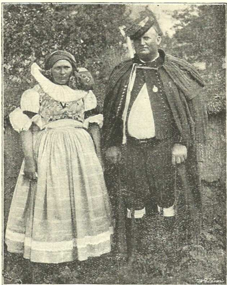
Hanáci z Křenovic u Kojetína.

nevěsty a družiček, původem svým až do středověku sahající, a nádherné „nevěstinské plachetky“ (úvodnice), kolem loktí svatebčanek ovinuté.